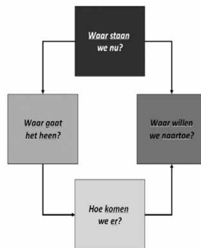
Figuur 1: Schema van toekomstverkenning

In de periode van 31 mei tot 10 juni 2010 hebben 43 studenten zijn, onder begeleiding van 3 docenten een toekomstverkenning uitgevoerd. Op donderdagmiddag 10 juni is deze afgesloten met een presentatie voor bestuurders. In deze korte periode is de gehele cyclus van toekomstverkenning met behulp van scenario's doorlopen. De vier hoofdvragen binnen deze cyclus zijn weergegeven in figuur 1.